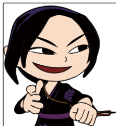
▲ポン・ニツネカムイ: 人間の世界に悪さをする 魔神ニツネカムイの子ども

ポン・オキキリムイが川沿いに山へ行くと、魔物の子どもポン・ニツネカムイに出会いました。ポン・ニツネカムイは魚を絶やそうとします。