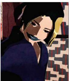
▲お母さん: 炉辺で子どもをあやしている