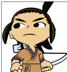
▲ポン・オキキリムイ: 人間の味方をする神 オキキリムイの子ども