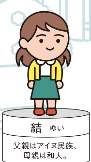
結 ゆい 父親はアイヌ民族、 母親は和人。