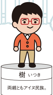
樹 いつき 両親ともアイヌ民族。