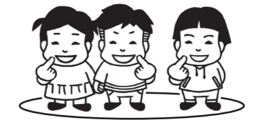
E 話し相手を含む 私たち