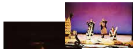
トンコリとムックリ