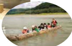
チザンク(舟おろしの儀礼)