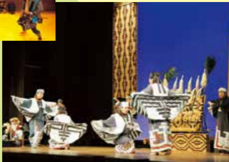
サロルンチカプリムセ(船の舞)

北海道各地にはアイヌの人たちが伝える伝統舞踊が保存され、国の重要無形民俗文化財に指定されています。踊りは、動物の所作をまねたもの、日々の労働を踊りに表したものの、娯楽を目的としたものなど、さまざまあります。