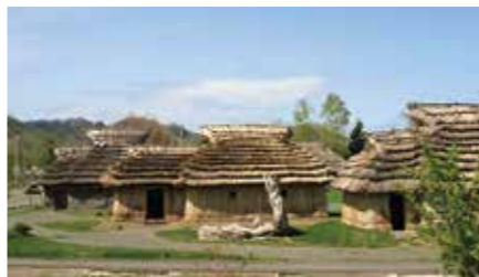
アイヌの伝統家屋チセ