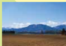
エネネエンスプリ