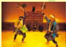
エムシムセ(鹿の舞)

北海道各地にはアイヌの人たちが伝える伝統舞踊が保存され、国の重要無形民俗文化財に指定されています。踊りは、動物の所作をまねたもの、日々の労働を踊りに表したものの、娯楽を目的としたものなど、さまざまあります。